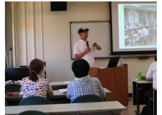
地域活動実践家から学びを深めます。