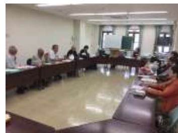
学年全員で意見交換

【問い合わせ先】 公益財団法人兵庫県生きがい創造協会 嬉野台生涯教育センター 多世代学習・地域づくり担当 〒673-1415 加東市下久米 1227-18 TEL 0795-44-0712 FAX 0795-44-1185 URL https://www.hyogo-ikigai.or.jp/ureshino-bo/