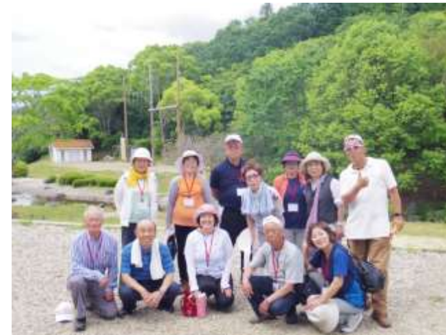
仲間との絆を深めつつ、見学や体験活動を通じて北播磨の魅力を再発見。