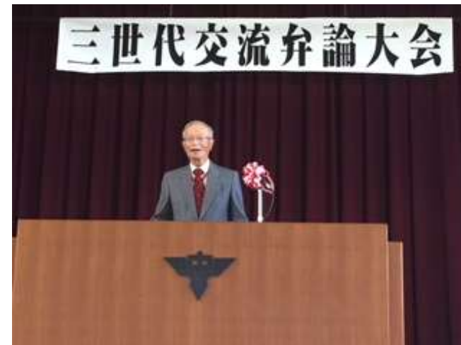
世代間交流時業では地域の若者との交流を楽しみます。