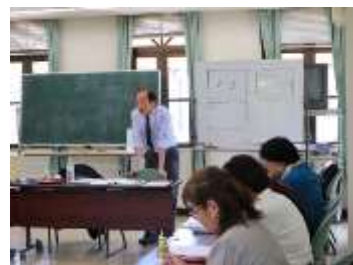
専門家に地域活動入門を学ぶ