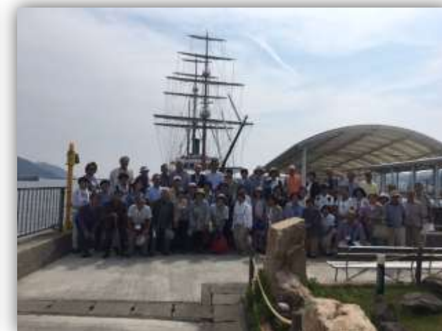
現地学習(多彩な活動を通じて広がる仲間の輪)