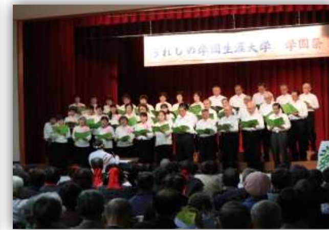
仲間との絆が深まる学園祭 学年舞台発表