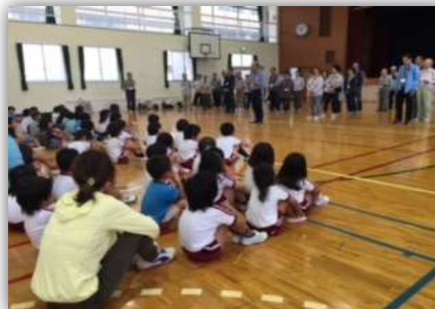
世代間交流事業(地域の子どもたちと交流)