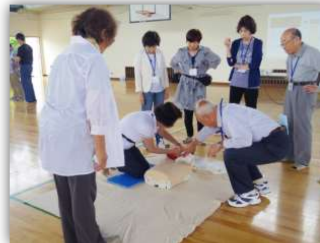
「知識」と「実践」をつなげて、生きがいづくり