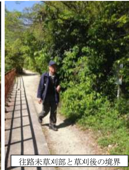
往路未草刈部と草刈後の境界