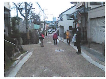
小浜の宿で活動中