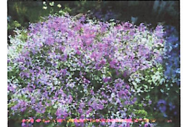
住宅庭のプランター花盛り