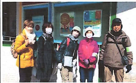
スタートは阪急売布神社駅