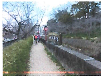
今年は遅い！大堀川花の道