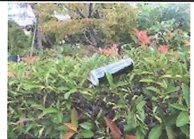
空き缶のポイ捨て