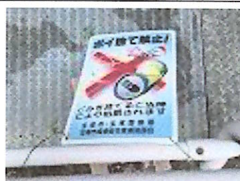
ポイ捨て禁止!の看板が脱落