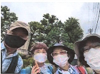
スタートは木接太夫顕彰碑