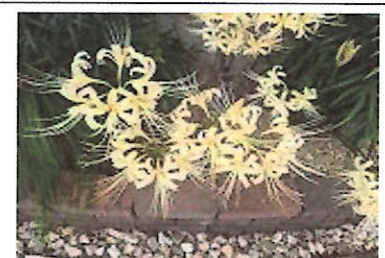
彼岸花! (シロバナマンジュシャゲ?)