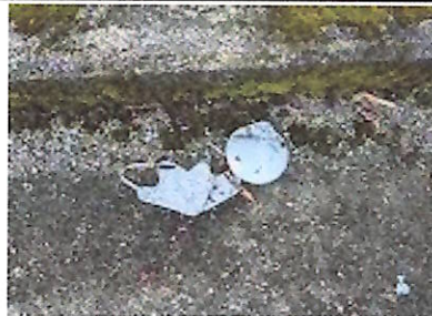
珍しくマスクごみが...