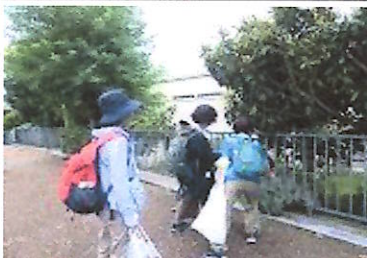
植木の山本で活動中