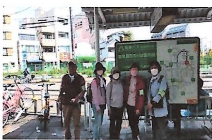
スタートは阪急園田駅