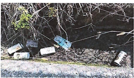
コーヒー空き缶がまとめてポイ捨て