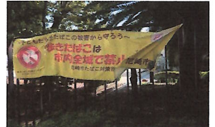
市内全域で歩きタバコ禁止