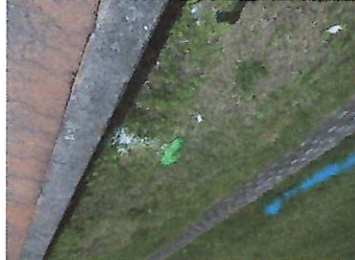
猪名川堤防のポイ捨て