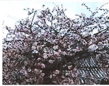
寺町の本興寺の梅