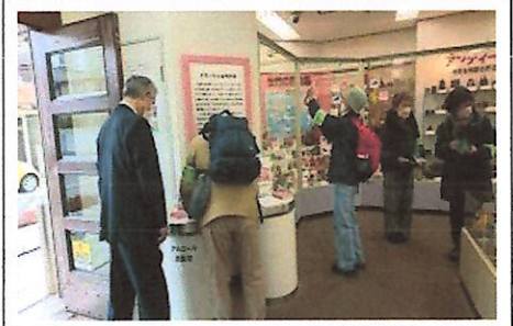
世界の貯金箱博物館