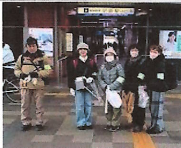
スタートは阪神尼崎駅