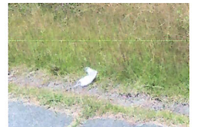
マスクは合計 5 枚を収集

計画時には、梅雨入りしているかも…と思っていた六月例会でしたが、全く予想に反して、憎らしいほどの晴天! 今日以前、歩いた時にびっくりするほどタバコの吸殻が落ちていた桑津橋からスタートしました。ちょっとうんざりしながら吸殻を拾っていると、「ありがとうございます」との声が。その言葉に力づけられ神津地域に入りました。予定していた岩屋遺跡・八幡神社は時間の関係で取りやめ、意外に涼しい散歩道を見つけ田能遺跡で昼食。多少道に迷いながらもちょっとした歴史探訪の会になりました。ゴミも多かったですが、感謝の言葉も多くいただき、暑くて疲れたけれど、心は“満足 (角たみ子)