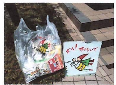
伊丹ボイ捨て追放マーク“クリンちゃん”