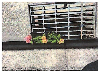
道路の排水口に花“ランタナ?!”