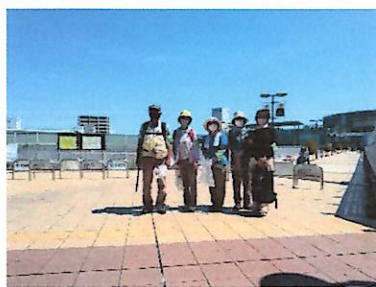
JR 伊丹駅前、全員参加の 5 名