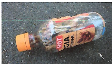
悪質! ペットボトル内にタバコ吸殻