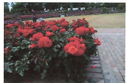
バラ公園内の真紅の薔薇