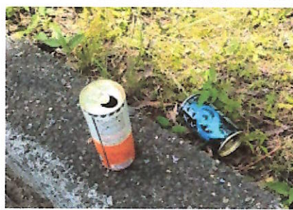
公園沿いのフェンス上に空き缶！