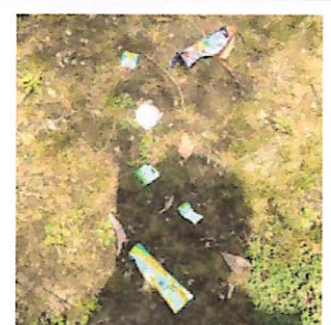
車道沿いでごみが散乱