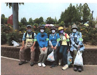
本日は全員参加の 5 名