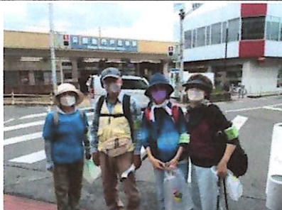
スタートの門戸厄神駅、参加者4名