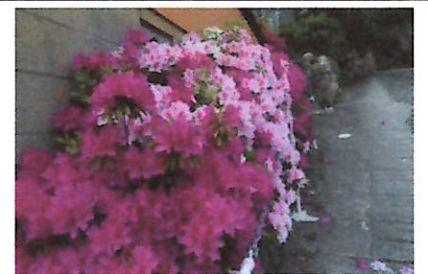
今が満開のつつじの花

【コメント】雨で延びた4月例会でしたが、当日の朝まで雨予想の為、出発を10:30に遅らせて実施。天候は曇り勝ちでしたが、薄日も射し適度に風も有って、まずまずの例会日よりでした。今回で3回目となる門戸厄神～廣田神社コースですが、全く違うコース設定でしたので、新鮮に感じられました。廣田神社のコバノミツバツツジの花は既に終わっていましたが、コース途中では、この時期のつつじの花や多くはの花が咲き誇って、まさに百花繚乱の趣きです。名前が判らない花も多く、スマホのアプリで名前を調べながら、しばし春のクリーン・ウォークを楽しむ事が出来ました。