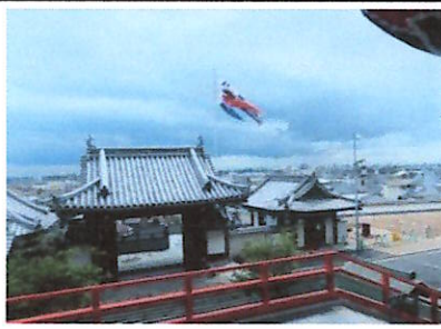
門戸厄神東光寺の鯉のぼり