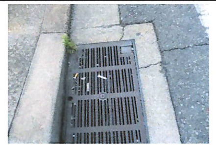
道路わきのタバコの吸い殻