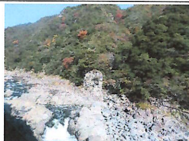
武庫川溪谷、紅葉には少し早い!