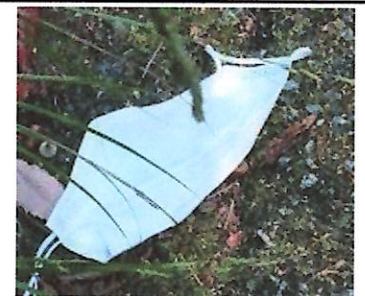
やはりマスクは落ちてます!