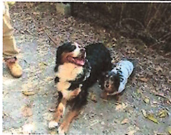
犬も廃線敷コースを往復中