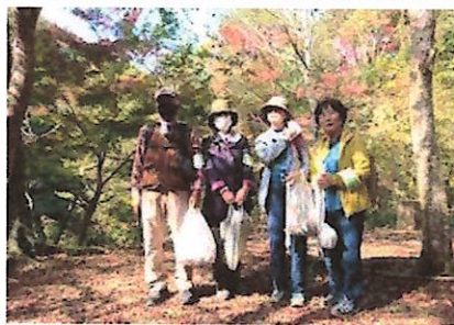
本日の参加者は 4 名