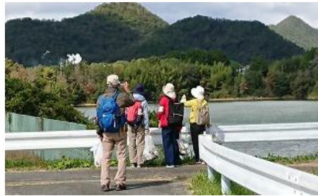
千丈寺湖で活動中