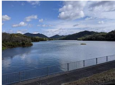
千丈寺湖 (昼食場所)