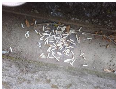
これはひどい! タバコの吸い殻