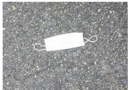
コロナ禍で目立つマスクポイ捨て