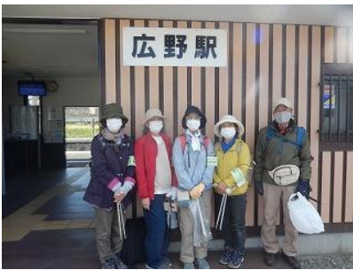
スタートは JR 広野駅。参加者 5 名