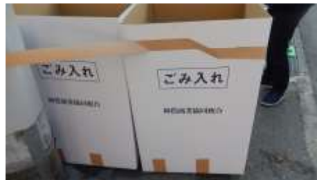
参道には、ごみ入れが用意されている