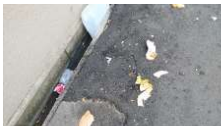
十日戎の露店付近のポイ捨て