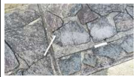
猪名川堤防の石垣にタバコ吸殻