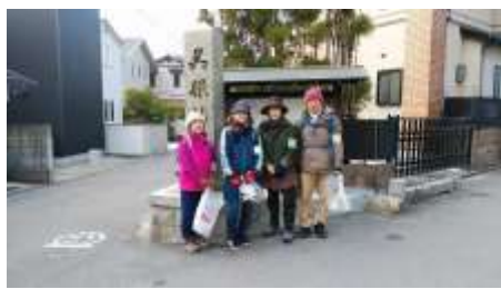
十日戎の呉服神社、4名でスタート!