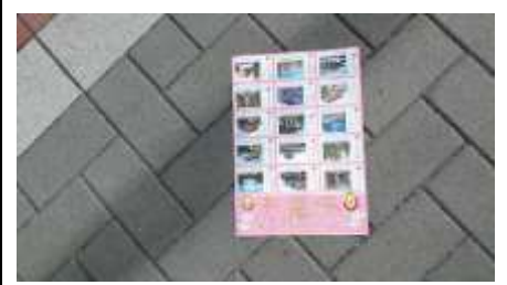
池田市観光 MAP のパンフレット!

【コメント】朝ドラ「まんぷく」で全国区に躍り出た池田駅を出発。まずは【残りえびす】の香が残る呉服神社へ、短い参道には露店食の残骸が落ちてました。池田最古の伊居太神社へ歩くがゴミは少ない。荘厳な奥深い神社に心が洗われる思いになりました。ウォンバットの可愛さに、ゴミ拾いの手も疎かになり動物園を後にする。望海亭ハイキングコースは自然災害の為【立入禁止】無念。緑化植物園に移動。美しい花を横目に池田城址へと歩く。タバコ吸殻は落ちてるが生活ゴミは少ない。最後はカップヌードルミュージアムに立ち寄り。人が多く、見学のみで帰路へ。本来の役目を忘れそうになる良いコースでした。