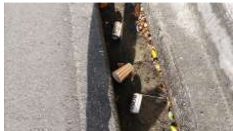
溝には捨てやすいのか?