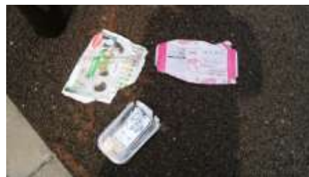
空き袋のポイ捨て!