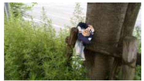
これは落とし物がごみに!