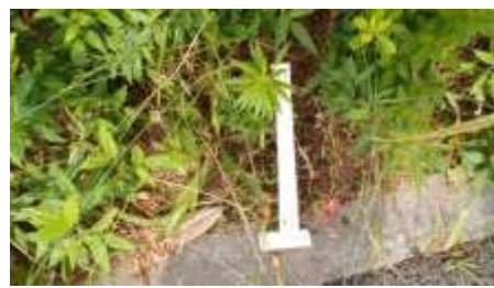
道路際の植え込みにはごみが多い