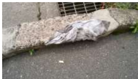
たばこの吸い殻が点々と...