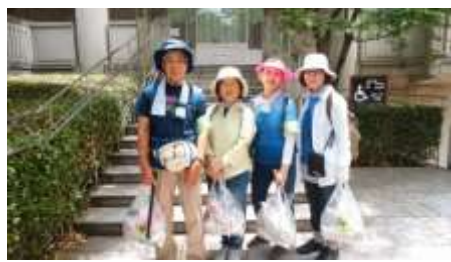
雨で1週間遅れの例会は4名参加