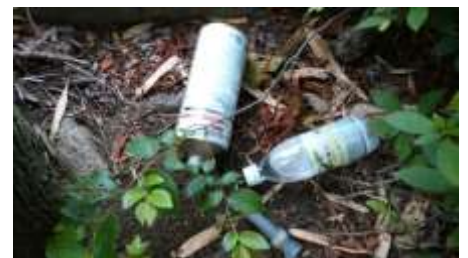
大きなボトルのごみも目立つ

【コメント】雨により一週間遅れの実施となったこの日は、梅雨の合間の貴重な晴れとなりました。予定変更の為、参加人数が4名と、少し寂しい活動になりましたが、前半は緑の多いコースで、ゴミも少なく、畑の作物や、通りすがりの家の庭の花を楽しみながら、活動しました。しかし、気温も上がってきた後半は、ゴミも多くなり、通りの名前が、綺麗な「さくら通り」なのに...と愚痴をいながら作業。天王寺川の汚さにもがっかり。そうこうしているうちに、目的地の宝塚市役所に到着。昼食兼打ち上げは、ちょっと優雅なパンの食べ放題で、元気を取り戻しました。