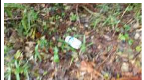
ハイキング道にペットボトルが