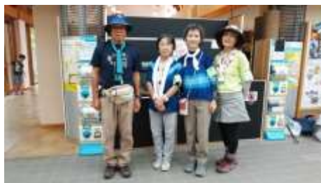
有馬富士公園.本日の参加4名