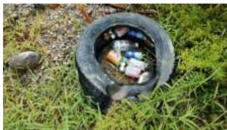
不法投棄のタイヤはごみの山