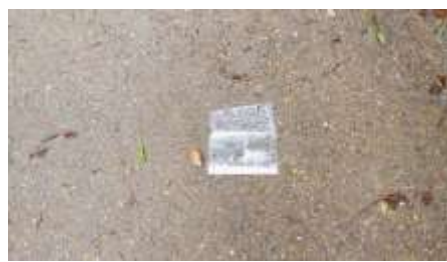
プラ袋が道路中央に捨てられている