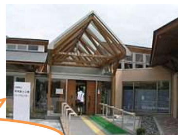
有馬富士公園パークセンター