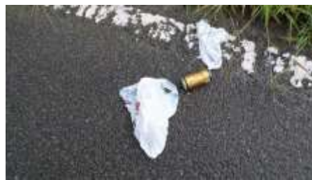
袋ごと空き缶も捨てる