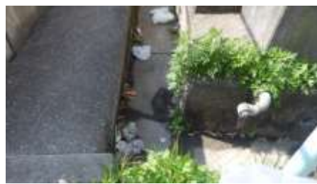
捨てやすい!排水溝はごみが!