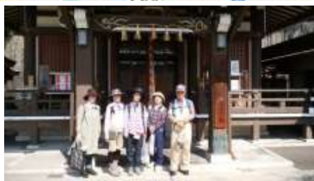
門戸厄神での集合写真.参加5名