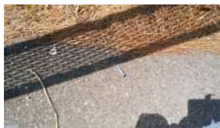
タバコの吸い殻は各所に!