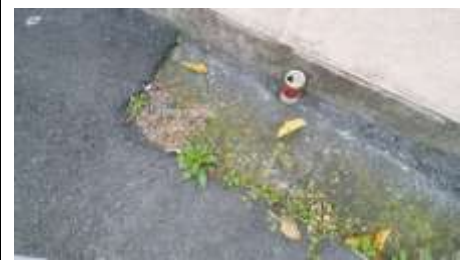
コーヒーの空き缶!