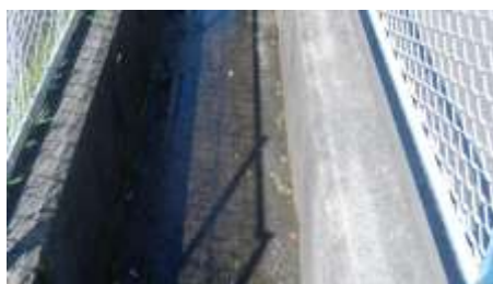
フェンス際にはタバコの吸い殻