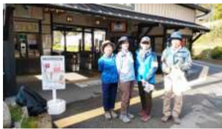
妙見口駅から4名でスタート!