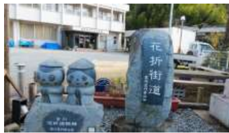
花折街道をクリーン・ウォーク