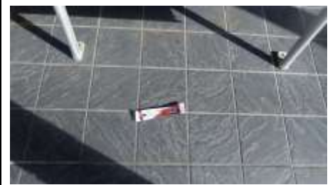
休憩所のベンチの下にゴミ!