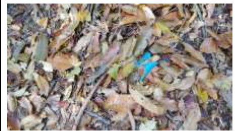
よく見ると山道の落葉の中にゴミが!