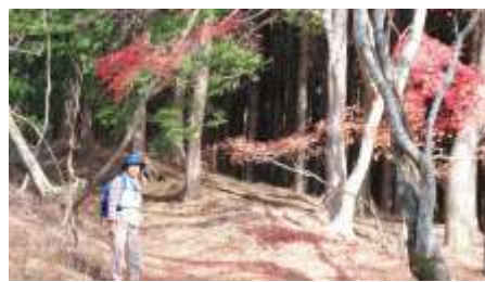
紅葉の中のクリーン・ウォーキング