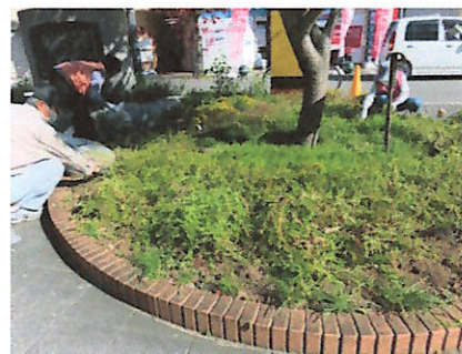
ポーチュラカ撤去