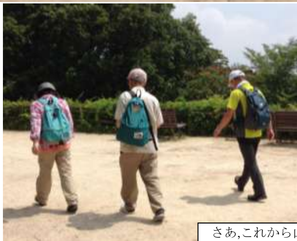
さあ、これから山頂だ!