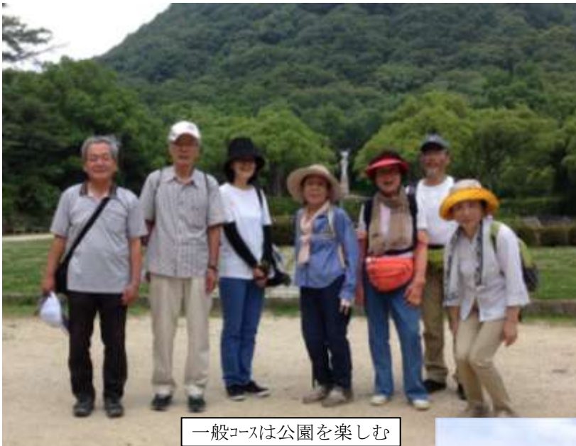
一般コースは公園を楽しむ