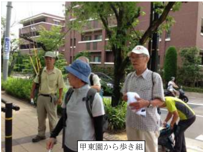
甲東園から歩き組