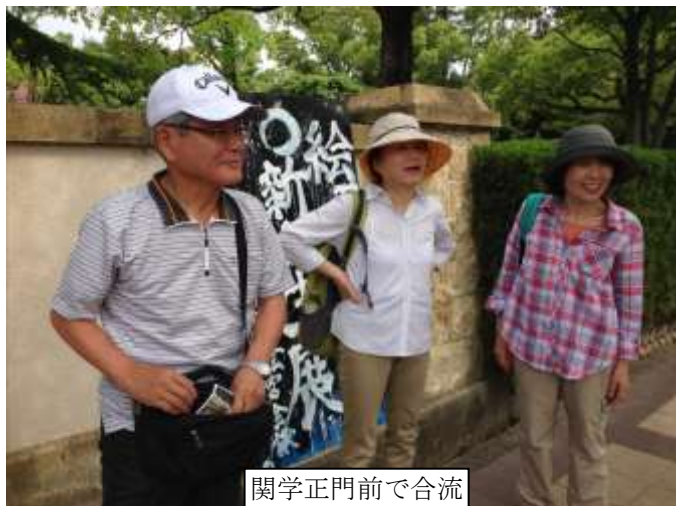
関学正門前で合流