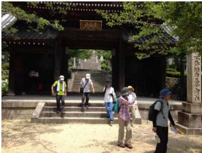
神呪寺を出て甲陽園へ