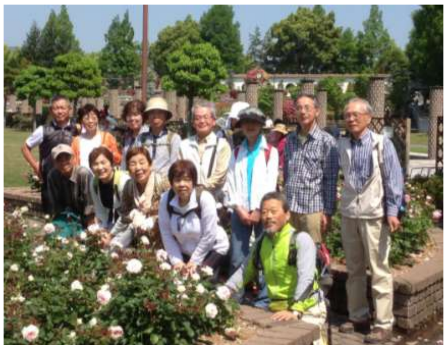
荒牧バラ公園到着集合写真