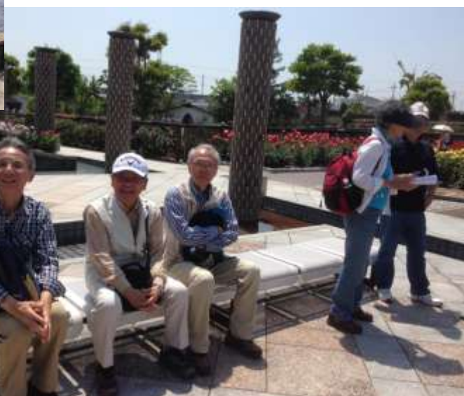
暑いなー 全部見た？