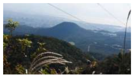
甲山が眼下に見えます