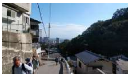
長い登りが続きます