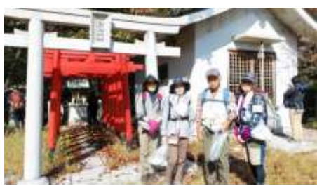
本日の参加者は4名！